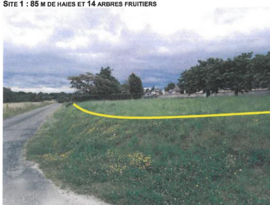
SITE 1 : 85 M DE HAIES ET 14 ARBRES FRUITIERS

Grâce au dossier monté avec l'aide de M. LÉGER, l'association « Prom'Haie » nous propose d'adhérer à leur association (cotisation de 50 € en 2020) et un projet de plantations s'élevant à 1.955,71 € HT (pour 14 arbres fruitiers, 85 mètres-linéaires de haie arbustive double et 220 mètres-linéaires de haie buissonnante double) localisées devant le cimetière et au Pouyalet, avec une aide envisageable de 964 € de la part du Conseil Départemental. Les plantations sont prévues fin janvier 2021 : les volontaires peuvent se faire connaître en Mairie.